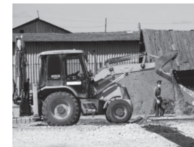
Ксения Малыгина. Фото автора