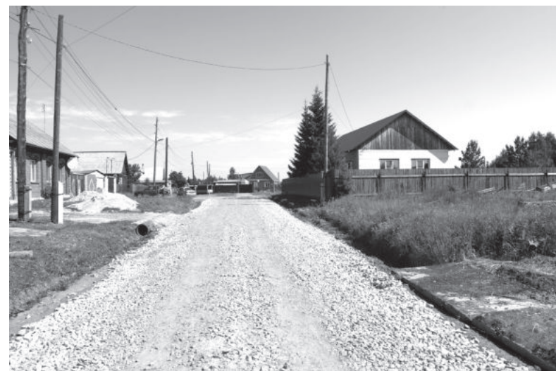
Дорога в деревне Мельниковой по улице Новой

шее время получим проектно-сметную документацию по реконструкции моста через речку Лягу в селе Горки. Есть желание, чтобы этот мост был не деревянный, который мы все время чиним, а железобетонный. С горкинским мостом нам не везет! У нас уже давно заключен контракт с проектной организацией, но положительного результата пока нет. Проект после